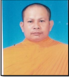
พระกรวิษุทธ์มมวโร (อินเทพ)